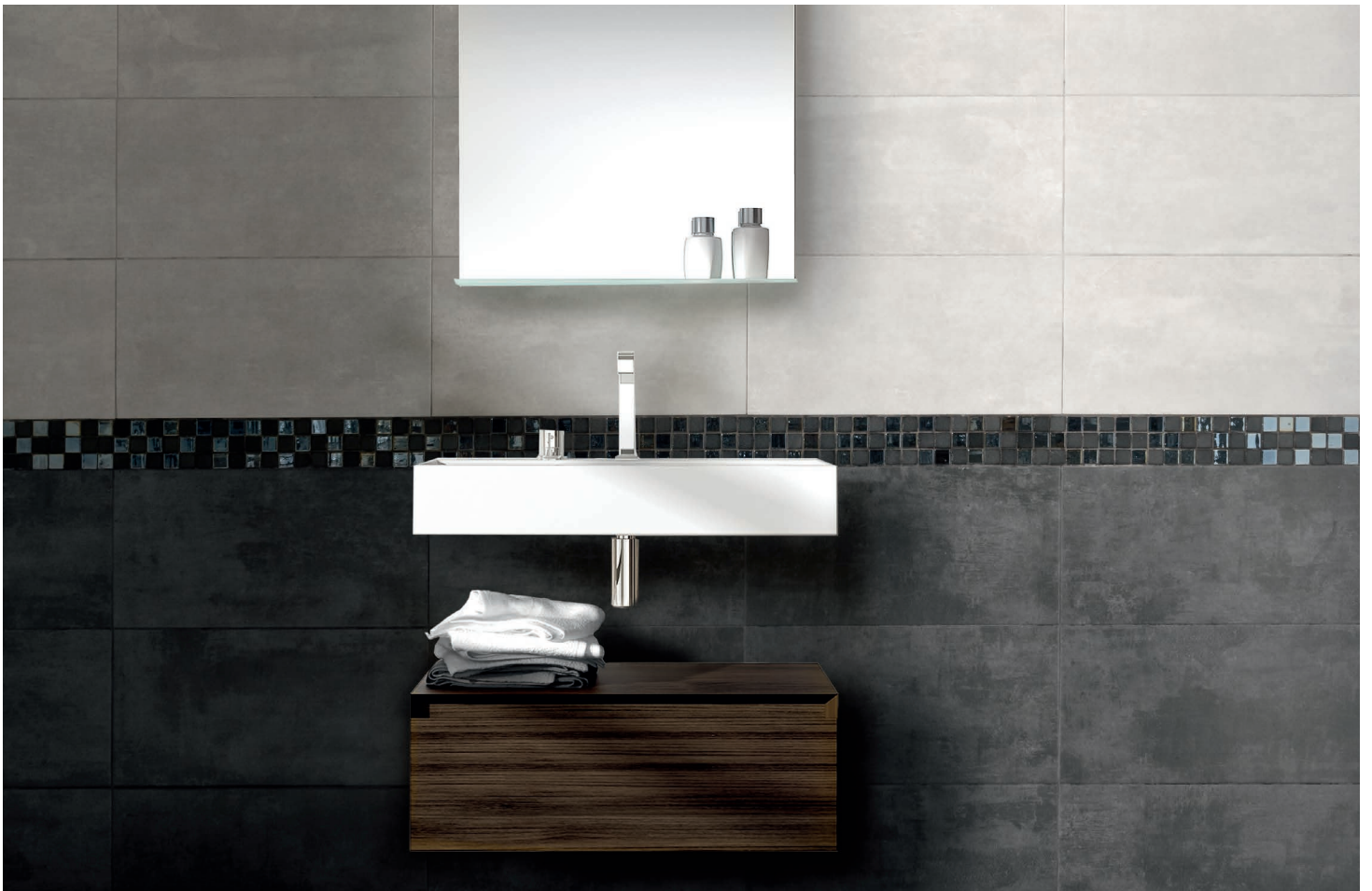
GRIS & GRAFITO