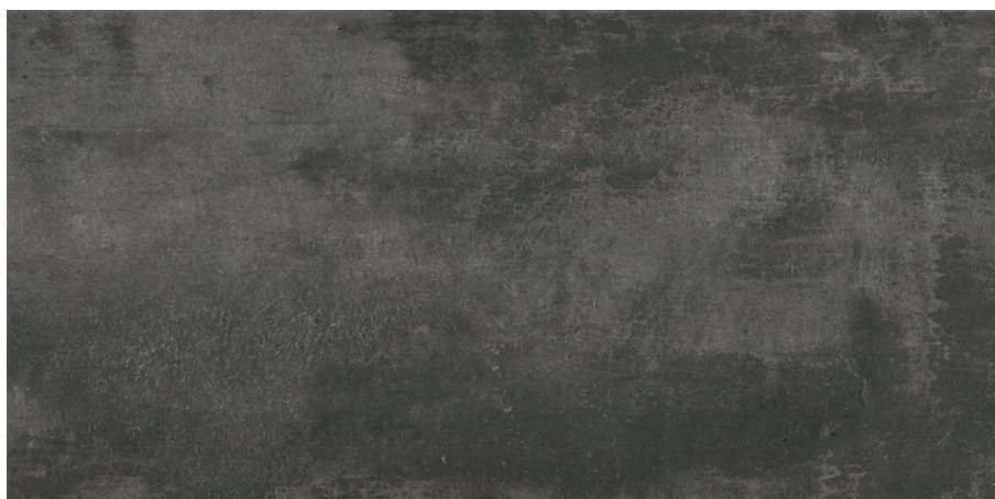
GRAFITO (Mat) 25 x 50 cm (9.85" x 19.69") UN.ST.GFT.1020.MT

Tous les items présentés dans ce document font partie du programme d'inventaire Olympia. Pour les commandes spéciales, veuillez contacter votre représentant de Tuiles Olympia.