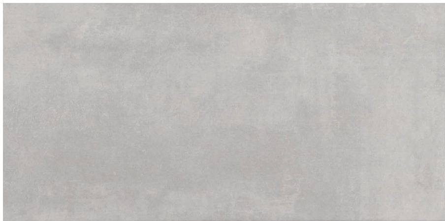
GRIS (Mat) 25 x 50 cm (9.85" x 19.69") UN.ST.GRI.1020.MT