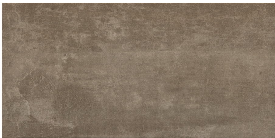
TAUPE (Mat) 25 x 50 cm (9.85" x 19.69") UN.ST.TPE.1020.MT